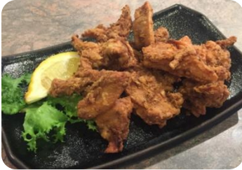
Tori Karaage Tori Karaage 若鶏の唐揚げ 8.5 Poulets frits à la japonaise / Japanese style deep fried chicken