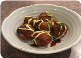
Takoyaki Balls (6pcs.) たこ焼き 7 Boulettes de pâte avec les morceaux de pieuvre / Round dumplings with octopus pieces