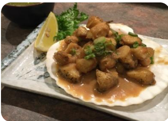
Tsubugai Karaage ツブ貝の唐揚げ 11 Fameuses palourdes frites du chef / Delicious deep fried melt shells