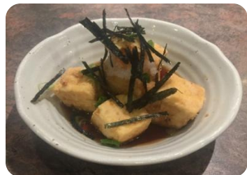
Agedashi Tofu 揚げ出し豆腐 6.5 Pates de fèves soya (tofu) frits / Deep fried bean cake (tofu)