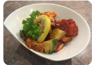
Kimuchi Tako タコとキュウリのキムチ和え 9 Concombre et pieuvre avec sauce piquante / Cucumber and octopus with hot sauce